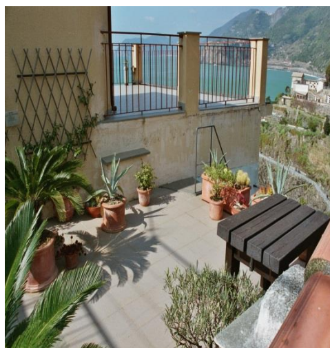
Toiture-terrasse Vue direction Monterosso