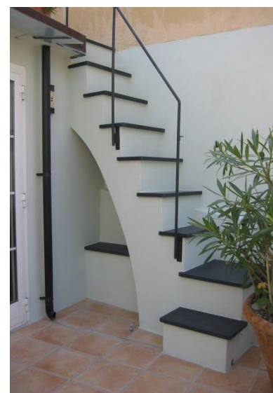
Terrasse devant la cuisine Escalier vers la toiture