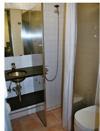
Salle de bains 2

Vacances à Manarola Itinéraire en train via Milano - Genova - Monterosso, y changer de train pour trois stations jusqu' à Manarola (prendre billets Suisse - La Spezia aller/retour). Itinéraire en voiture : via Genova ou Milano à La Spezia, y traverser le centre en direction de Riomaggiore/Cinque Terre (Droit de stationnement à Manarola 25 Fr./jour).