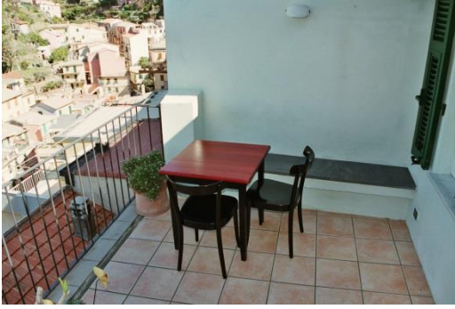
Terrasse devant cuisine, direction village