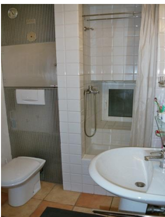
Salle de bains 1