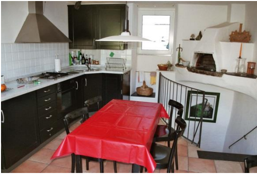
Cuisine, direction Belvedere