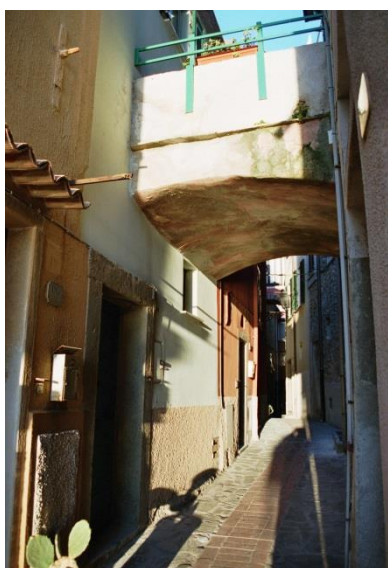
Entrée Via Belvedere Vue direction village